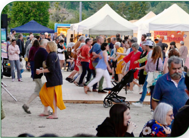
JUILLET : Soir de marché