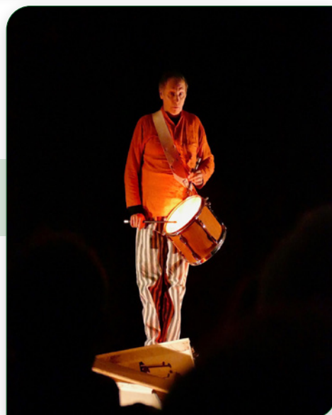
NOVEMBRE : Spectacle « Le paradoxe de l'endive »