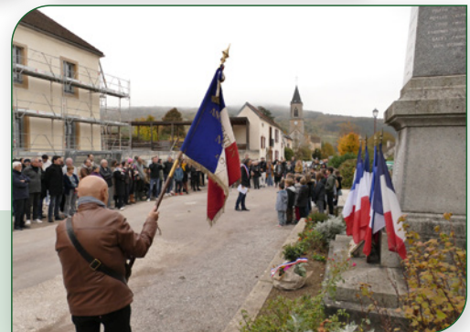
NOVEMBRE : Armistice du 11 novembre 1918